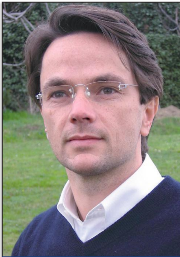
Stefano Viglione è sindaco di Mondovì dal 2007

Si tratta di società consortili che avranno il compito di gestire alcune funzioni tecniche, logistiche ed amministrative